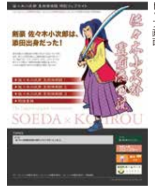
佐々木小次郎のサイトキャラクターのトップ画面

ざる歴史の一端に迫ります。この特設Webサイトは『添田町観光ナビ』からアクセスしてご覧ください。